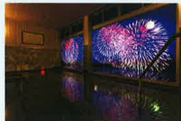
三ヶ日温泉「万葉の華」