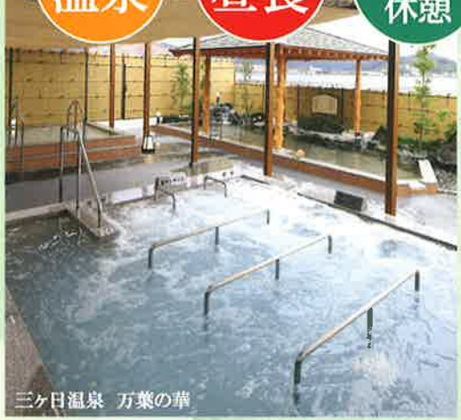
三ヶ日温泉 万葉の華