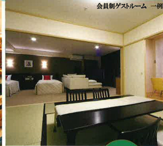
会員制ゲストルーム 一例