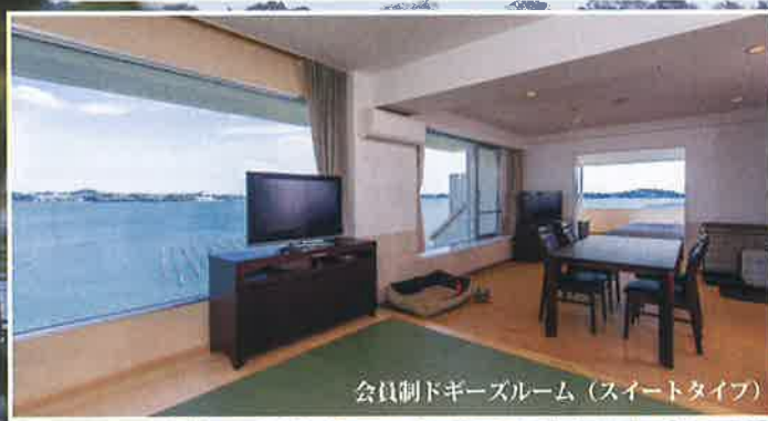
会員制ドギーズルーム (スイートタイプ)